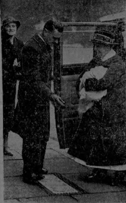
UNA HEREDERA PRINCIPESCA

El nuevo trasatlántico francés "Normandie" ha venido a poner de manifiesto la creciente importancia de los productos sintéticos, los que desempeñan papel importantísimo en su decorado. El Dulux, por ejemplo, artículo fabricado a base sintética, es el material con que están pintados los cuartos de baño y de lavatorio; los asientos destinados al uso de los oficiales de a bordo y buen número de los destinados al pasaje están tapizados de Fabrikoid; en multitud de cosas se ha empleado allí el rayón, y con uno muy fino que fabrica J. Colcombet se han tapizado los asientos del fumadero; y las cortinas de este mismo salón, que parecen de cristal, son de Clar-Apel en tiras.